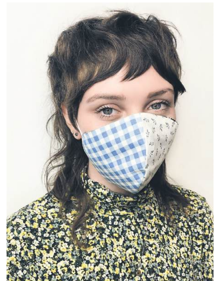
So sieht's aus. Heute sind die Übergänge weicher und fließender, hinten sehen die Haare natürlich herausgewachsen und nicht auf Kante frisiert aus. Der moderne Vokuhila ist gendernneutral – und mit ihm wird der Zwischenzustand, in dem alle Welt gerade zwangsläufig verharrt, nun auch auf dem Kopf sichtbar.