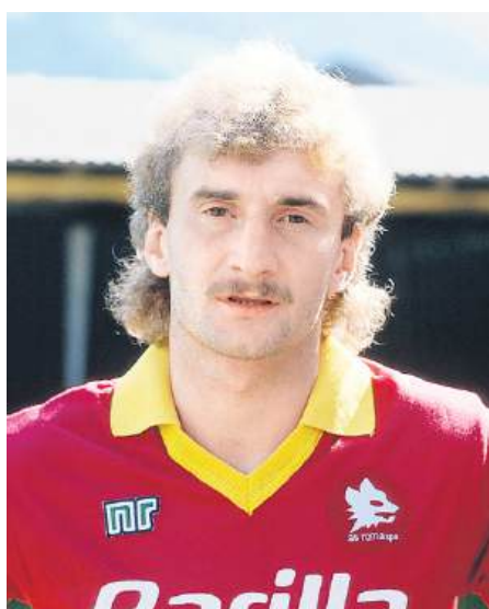
Rudi Völlner trug immer diese Frisur, auch als er 1987 beim AS Rom spielte.